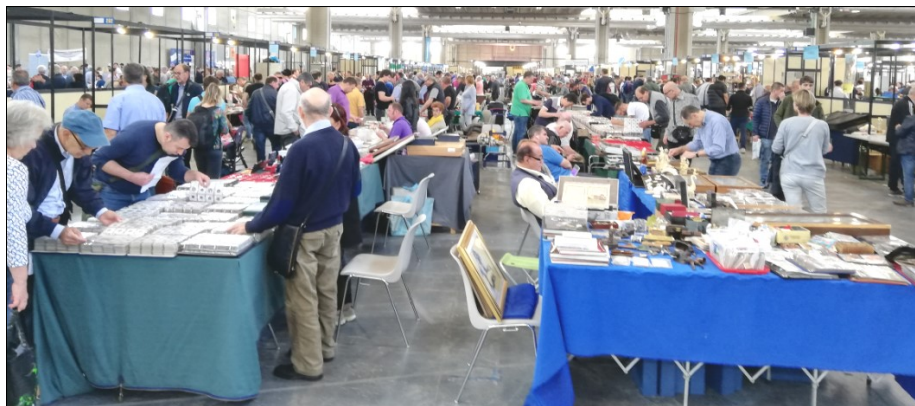
Utrinek s sejmišča v Veroni.