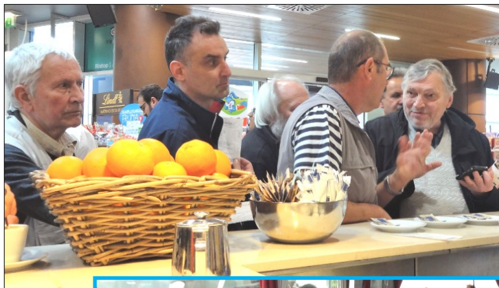
Levo: Bojni posvet ob kavi Sredina: Utrinek z avtobusa Spodaj: Napad na sejmišče

Kot vsako leto pa smo se konec maja podali na obisk Verone (25. 5. 2019).