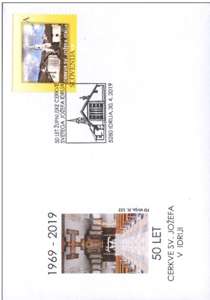
FDI št. 122 — 50 let župnijske cerkve sv. Jožefa v Idriji