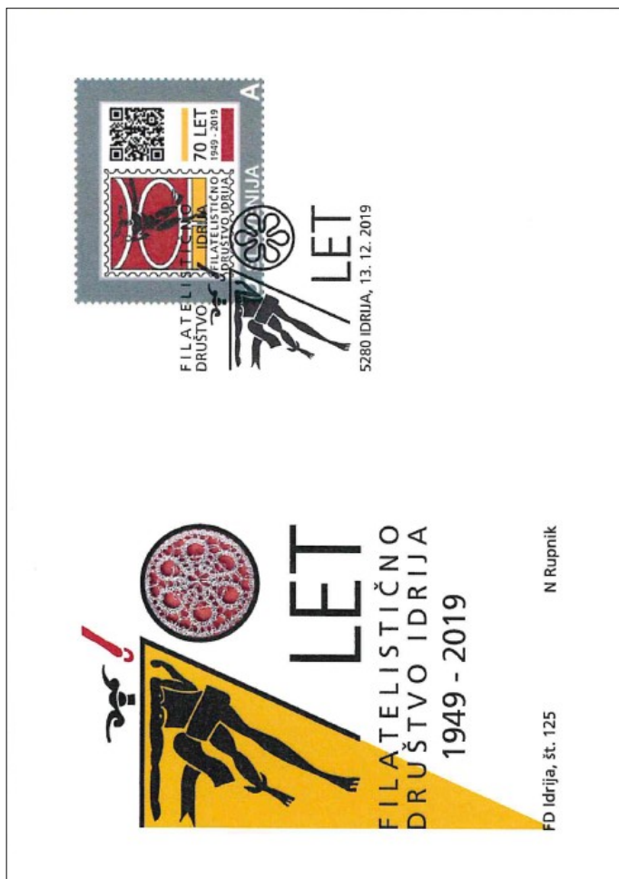
FDI št. 125 — Filatelistično društvo Idrija — 70 let