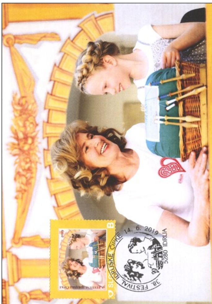
FDI št. 123 — 38. festival idrijske čipke