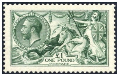
Podoba Jurija V. na znamki Seahorse za 1 funt iz leta 1913.

nekako takole: po dražbi se je vojvoda vrnil v svojo palačo, kjer ga je eden od slug pozdravil z besedami: »Ali je vaše kraljevo visočanstvo slišalo, da je neki prekleti bedak pravkar plačal 1.450 funtov za eno samo znamko?« »Ta prekleti bedak sem bil jaz,« naj bi mu odvrnil bodoči monarh.