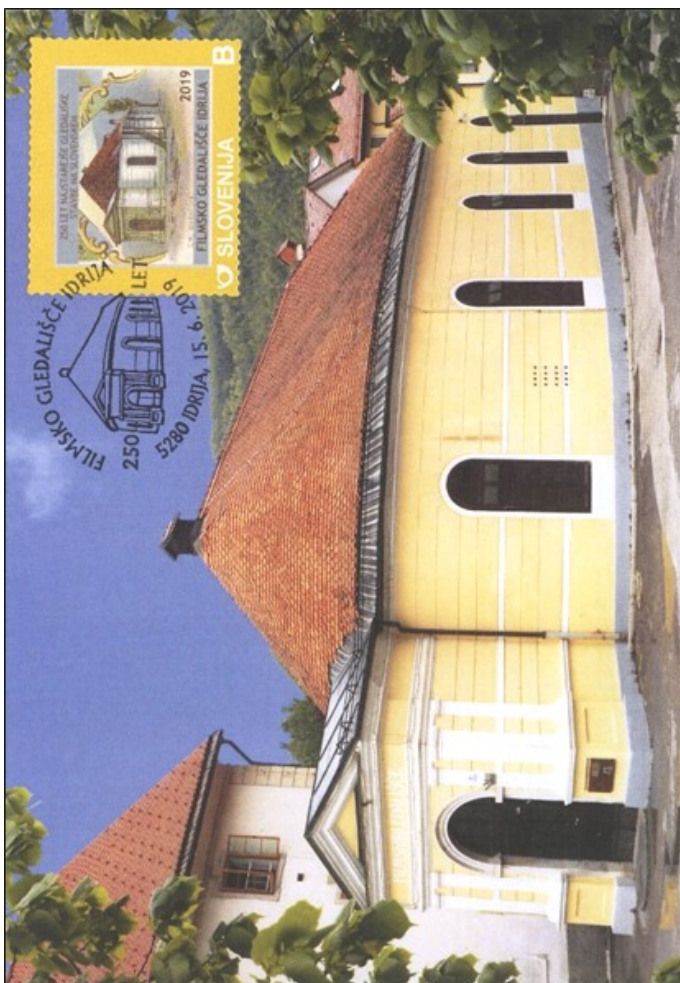
FDI št. 124 — 250 let najstarejše gledališke stavbe na Slovenskem