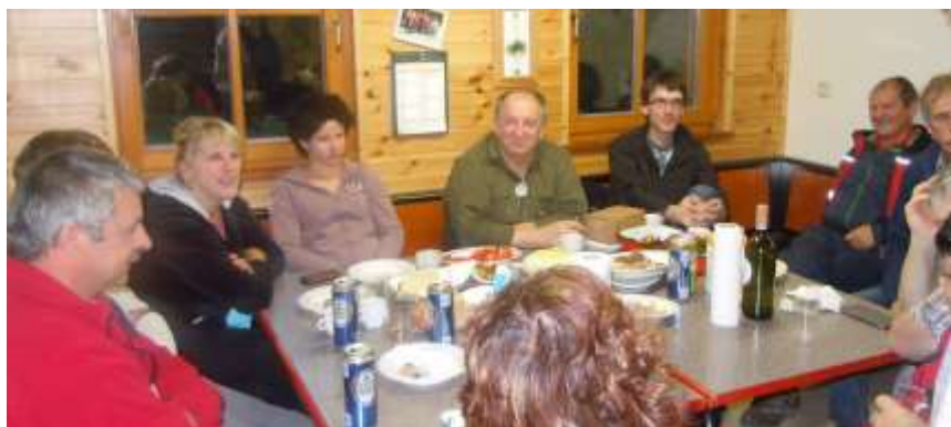
Ko pade mrak se preselimo v kočo.