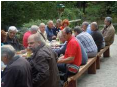
Za polno mizo.