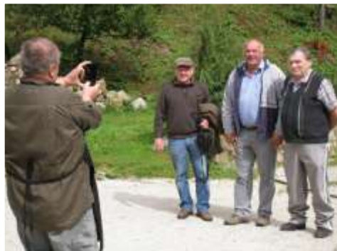
Poslanec in župan ob gostitelju.