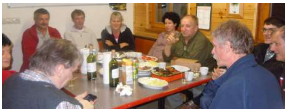
Klepet traja in traja.