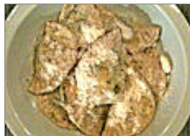
Schlutzkrapfni so podobni raviolom.