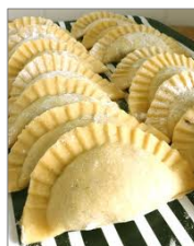
Ravioli kvadratne in polkrožne oblike