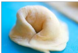
Moldavijski coltunasi s sirom

Pa naj vseeno povzamem nekaj bistvenih lastnosti o coltunasih. So zelo različnih oblik: kvadratni, polkrožni, zaviti, zviti ... in polnjeni: s sirom, skuto, zeljem, špináčo, mesom različnih vrst, krompirjem in dodatki.